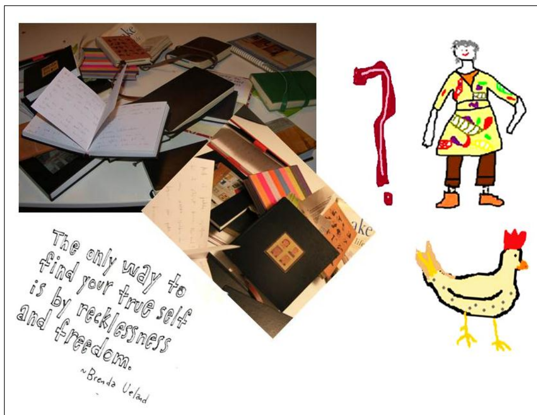
Mynd 1 – Myndin fylgdi erindi höfundar í Ritveri á Menntavísindasviði Háskóla Íslands.