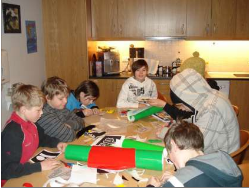
Mynd 1 – Skorið út í gluggafilmur.

Til frekari skýringar má nefna að Vísindapælingar eru byggðar á efni af Vísindavef Háskóla Íslands ( http://www.visindavefur.is ). Tröppuprekið byggðist á tímamælingum á kirkjutröppunum við Akureyrarkirkju en þær eru á annað hundrað. Í viðfangsefninu Umbúðir var skoðað hvað merkingar á umbúðum þýða. Í Hringasmíði var smíðað úr beinum, horni og tré. Í Leiklist var æft og flutt leikrit og í Fjöltækni var sniðið úr taui. Í Stressfroskur er saumaður froskur með grjónaþyllingu. Þegar haldið er English teaparty er te að sjálf-sögðu í boði og aðeins töluð enska. Flottur morgunverður samanstendur af steiktum eggjum, fleski og pönnukökum.