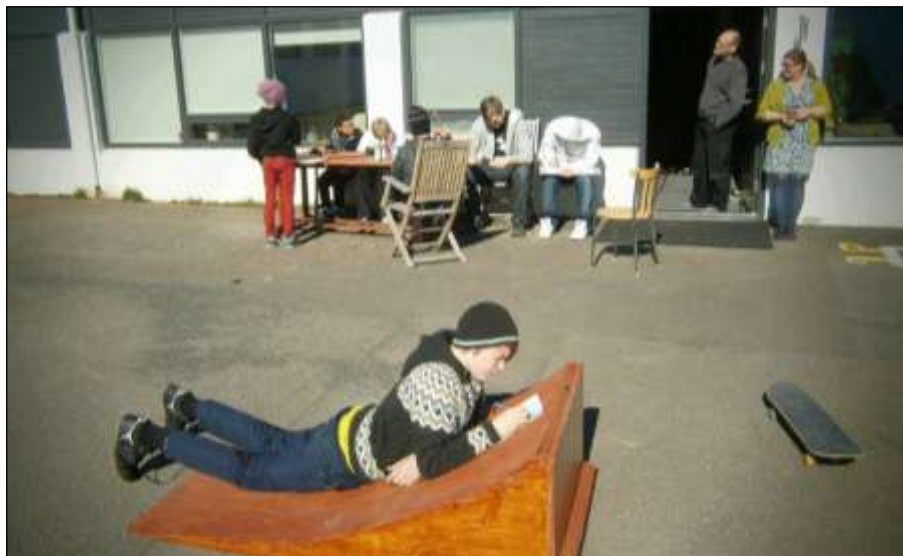
Mynd 6 – Ritgerðarskrif í vorsólinni.

Loks er að nefna að einn af kennurum skólans er mikill áhugamaður um fugla og er fuglaskoðun því oft á dagskrá.