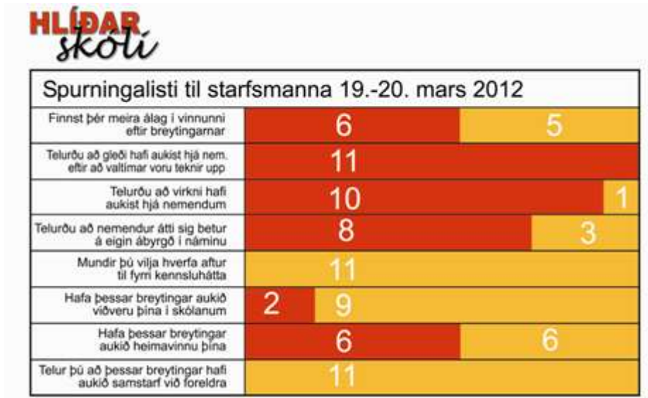
Mynd 8 – Niðurstöður viðhorfakönnunar meðal starfsfólks. Rauði liturinn táknar Já og sá guli Nei .

Loks hafa viðhorf starfsmanna verið könnuð. Í mars 2012 var spurningalisti lagður fyrir þá þar sem m.a. var spurt um vinnuálag, starfsgleði nemenda, virkni þeirra og ábyrgð. Þá var spurt um viðhorf starfsmannanna til breytinganna.