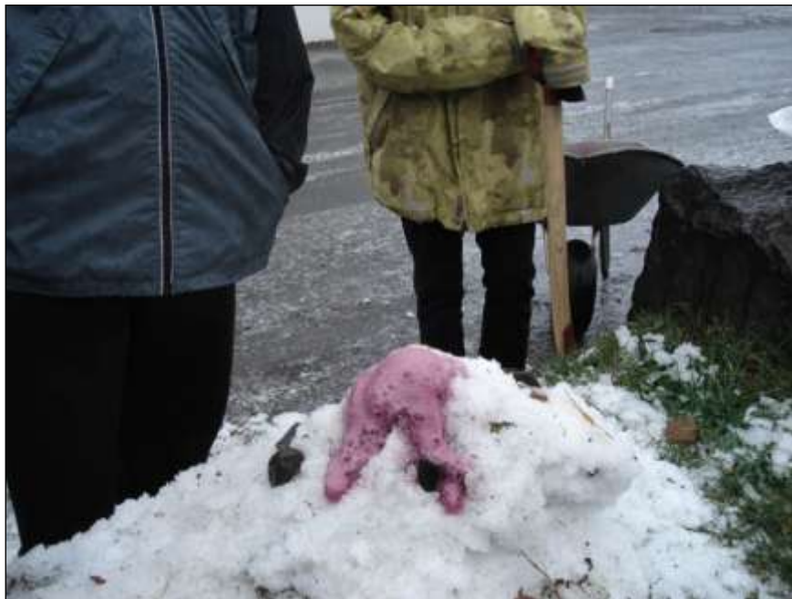
Mynd 4 – „Alvöru“ eldgos (efnafræðitilraun).